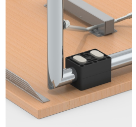
Stapelschoner schützen die Tischplatte vor Kratzspuren