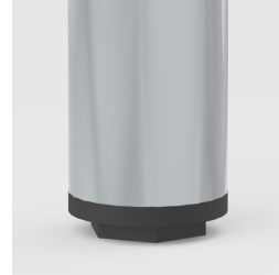
Bodenschoner mit Niveauegleich: gleicht Bodenebenheiten aus