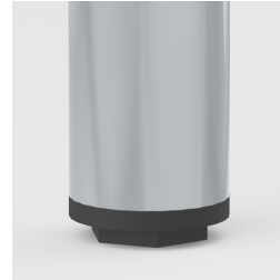
Bodenschoner mit Niveauegleich: gleicht Bodenebenheiten aus