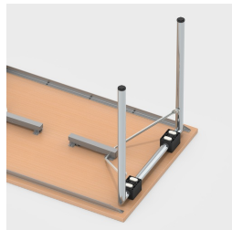
Einfaches Einklappen der Tischbeine