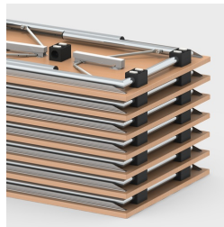
Bis zu 16 Tische stapelbar