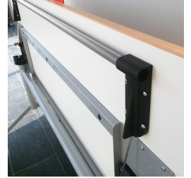
Auslösen der Klappfunktion mittels 2-Hand- Sicherheitsbedienung