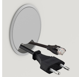
Optional mit seitlichem Kabeldurchlass