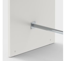
Inklusive Fußstütze zum bequemen ablegen der Füße