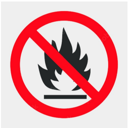
Trägerplattenmaterial schwer entflammbar nach DIN 4102 B1