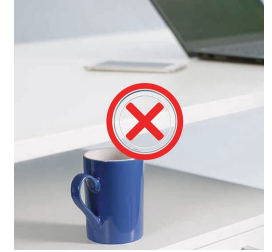
Kollisionsschutz minimiert das Risiko von Schäden beim Auf- und Abfahren