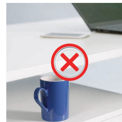
Kollisionsschutz minimiert das Risiko von Schäden beim Auf- und Abfahren