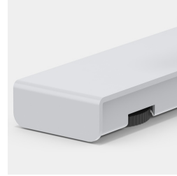
Bodenschoner mit Niveauegleich zum einfachen Ausgleichen von Bodenunebenheiten