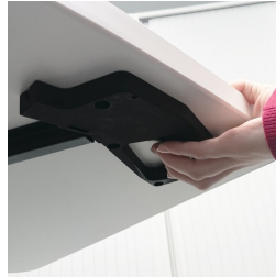
Sicherheitshandauslöser verhindert unbeabsichtigtes Auslösen der Höhenverstellung