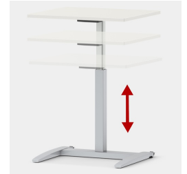
Stufenlos höhenverstellbar im Bereich von 70-110 cm