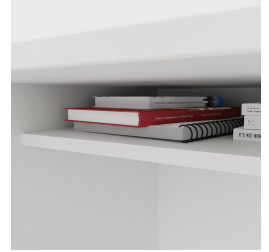
Inklusive praktischer Ablage