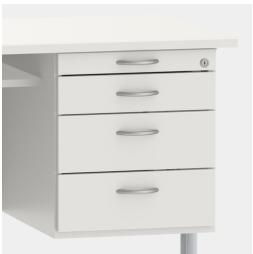
Unterschrank inkl. Utensilienauszug und Schubladen mit Einzugsdämpfung und Zentralverschluss