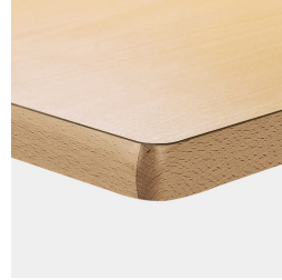
Optional Tischplatte melaminharzbeschichtet mit Massivholzkante