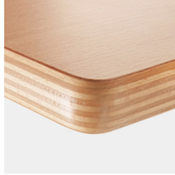
Optional Tischplatte Multiplex melaminharzbeschichtet