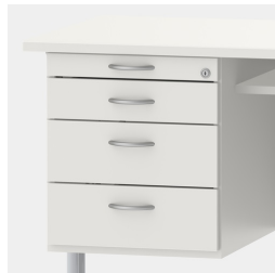
Unterschrank inkl. Utensilienauszug und Schubladen mit Einzugsdämpfung und Zentralverschluss