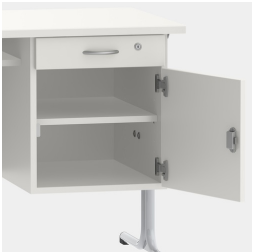
Unterschrank inkl. Schublade, mittels Sicherheitsschloss abschließbar