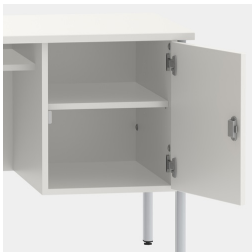
Unterschrank, inkl. einem Fachboden, mittels Sicherheitschloss abschließbar