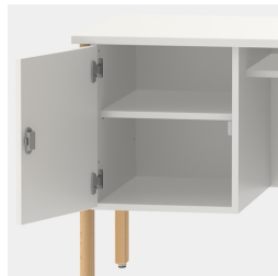
Unterschrank inkl. einem Fachboden, mittels Sicherheitsschloss abschließbar