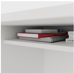
Inklusive praktischer Ablage