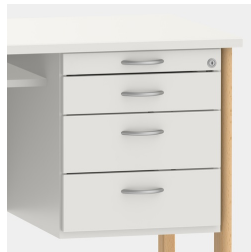
Unterschrank inkl. Utensilienauszug und Schubladen mit Einzugsdämpfung und Zentralverschluss