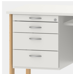
Unterschrank inkl. Utensilienauszug und Schubladen mit Einzugsdämpfung und Zentralverschluss