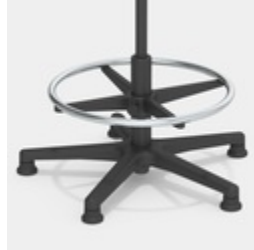
Erhöhung mit verchromtem Fußring, höhenverstellbar