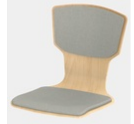
Optional mit Sitz- und Rückenpolster