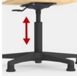
Höhenverstellung durch Sicherheitsgasfeder