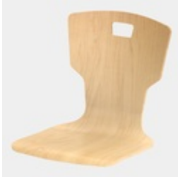
Optional mit Griffloch in Trapezform (nicht mit Rückenpolster)