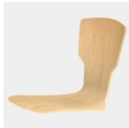
Körpergerecht geformte Sitzschale