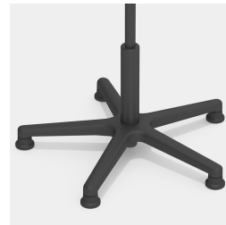
Absolut robustes Kunststoff-Fußkreuz in schwarz