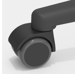
Optional mit lastabhängig gebremsten Rollen