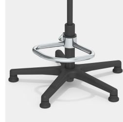
Optional mit Teilfußring