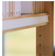
Einfache Verstellung der Böden durch Lochreihe