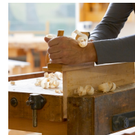
Massives Buchenholz aus nachhaltiger Forstwirtschaft