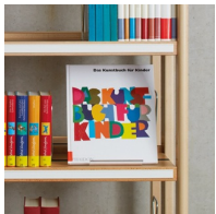
Böden mit Beschriftungsleiste