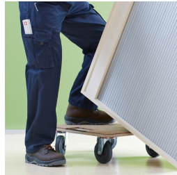
Korpus ab Werk fest verdübelt und verleimt für schnellen Aufbau vor Ort