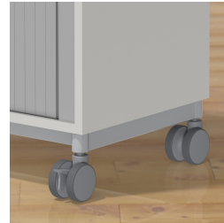
Rollladenschrank optional fahrbar mit Rollen