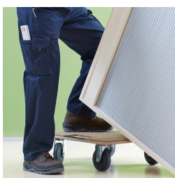
Korpus ab Werk fest verdübelt und verleimt für schnellen Aufbau vor Ort