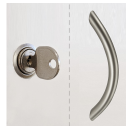
Standardmäßig mit Schloss und Griff, 1 OH mit Schloss oder Griff