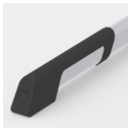
Bodenschoner mit integriertem Trittschutz