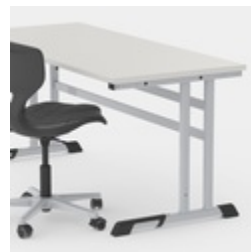
Durch C-Form kein Stören der Tischbeine beim Ein- und Aussteigen