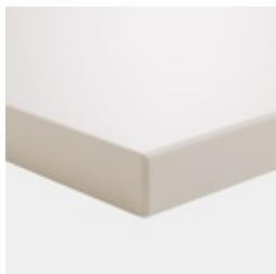
Tischplatte melaminharzbeschichtet mit robuster Kunststoffkante