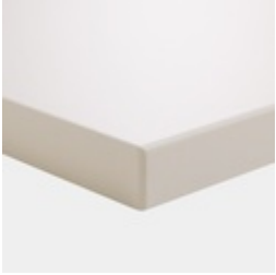
Tischplatte melaminharzbeschichtet mit robuster Kunststoffkante