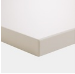
Tischplatte melaminharzbeschichtet mit robuster Kunststoffkante