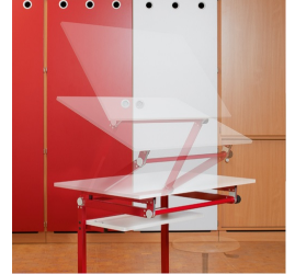
Robustes, standsicheres und stufenlos einstellbares Gestell aus Metall