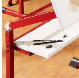
Mit praktischer Ablage für Utensilien