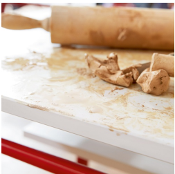
Keine Chance für Schmutz dank fest angeleimter Kunststoffkante