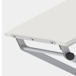
Optional mit Buch- Anschlagleiste