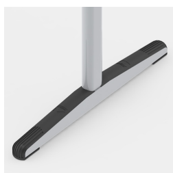
Bodenschoner mit durchgehendem Trittschutz