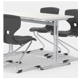
Durch Mittelsäulengestell beidseitig bestuhlbar