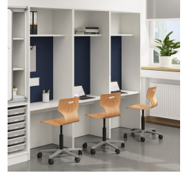
Seitenwände für besseren Blend- und Sichtschutz