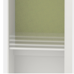
Tischplatte höhenverstellbar; Kabeldurchlass optional