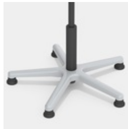
Absolut robustes Alu-Fußkreuz