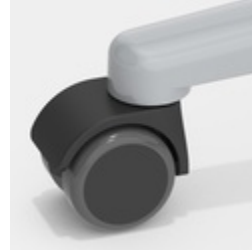
Optional mit lastabhängig gebremsten Rollen