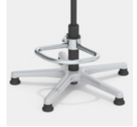
Optional mit Teilfußring