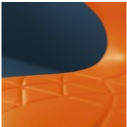
Sitzschale mit integrierten Lüftungskanälen