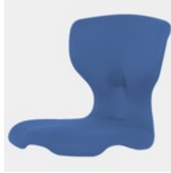
Optional Sitzschale Vollpolster ab Größe 5