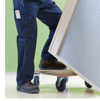
Korpus ab Werk fest verdübelt und verleimt für schnellen Aufbau vor Ort