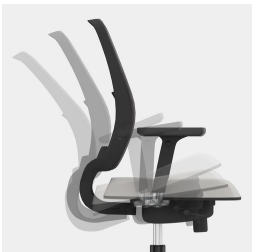
Synchronmechanik: Federkraft bzw. Widerstand an Körpergewicht anpassbar