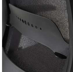
Netzrückenlehne schwarz, mit Lordosenstützverstellung