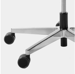
Elegantes, hochwertiges Alu-Fußkreuz