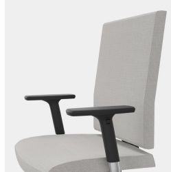
Ergonomisch geformte Rückenlehne