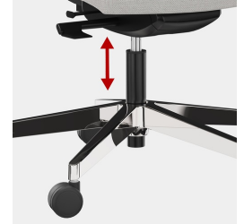
Stufenlose Gaslifthöhenverstellung inkl. Sitztiefenfederung