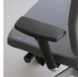
Armlehne dreidimensional verstellbar