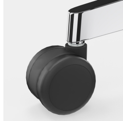
Lastabhängig gebremste Sicherheitsrollen verhindern ungewolltes Wegrollen