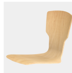
Körpergerecht geformte Sitzschale