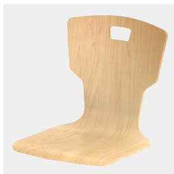
Optional mit Griffloch in Trapezform (nicht mit Rückenpolster)