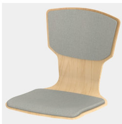
Optional mit Sitz- und Rückenpolster