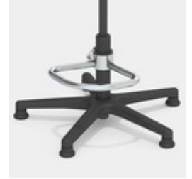
Optional mit Teilfußring