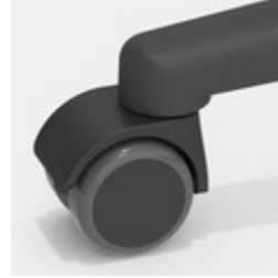
Optional mit lastabhängig gebremsten Rollen