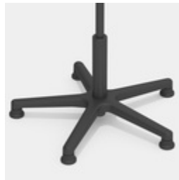
Absolut robustes Kunststoff-Fußkreuz in schwarz