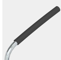
Inklusive Armlehne mit schwarzem Softgrip-Überzug