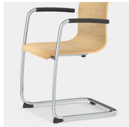
Robustes Freischwinger-Gestell mit Armlehne