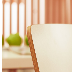
Sitzschale optional mit kratzfestem Multiplex Dekor beschichtet