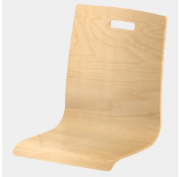
Optional mit rechteckigem Griffloch (nicht mit Rückenpolster)