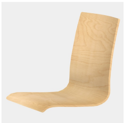
Körpergerecht geformte Sitzschale