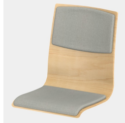
Optional mit Sitz- und Rückenpolster