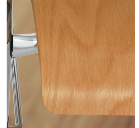
Sitzschale umweltfreundlich lackiert mit Lack auf Wasserbasis