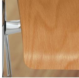
Sitzschale umweltfreundlich lackiert mit Lack auf Wasserbasis