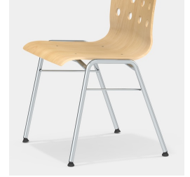
Robustes 4-Bein Gestell