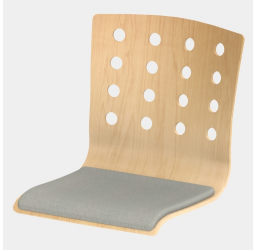
Optional mit Sitzpolster