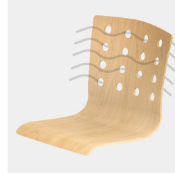
Sitzschale mit runden Ausstanzungen sorgt für optimale Luftzirkulation