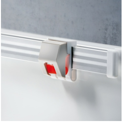
Optional mit Bilderklemmleiste