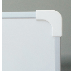
Kantenschutz durch gerundete „Sicherheitsecken“