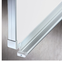
Passende Ablageleiste für Kreide und Stifte