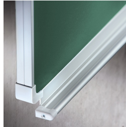
Passende Ablageleiste für Kreide und Stifte