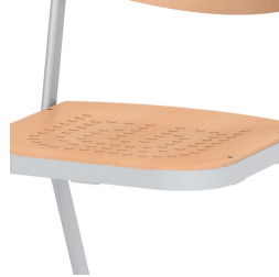
Sitzfläche mit eingepressten, rutschhemmenden Noppen