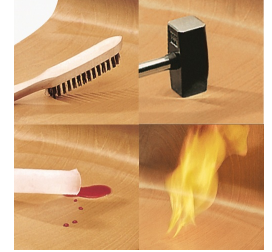
Sitz und Rücken melaminharzbeschichtet: kratz-, bruch-, stoßfest & schwer entflammbar