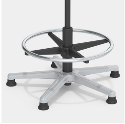
Robustes Alu-Fußkreuz mit Erhöhung und verchromtem Fußring, höhenverstellbar