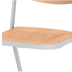
Sitzfläche mit eingepressten, rutschhemmenden Noppen