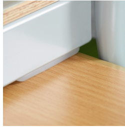
Plattenschoner schützen den Tisch beim Aufstuhlen