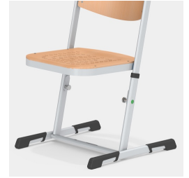
Stabiles, höhenverstellbares Kufengestell