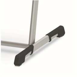
Bodenschoner mit integriertem Trittschutz