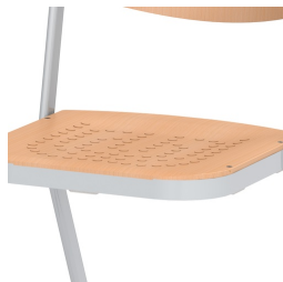
Sitzfläche mit eingepressten, rutschhemmenden Noppen