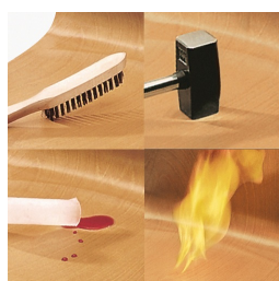
Sitz und Rücken melaminharzbeschichtet: kratz-, bruch-, stoßfest & schwer entflammbar