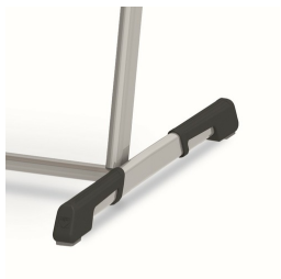
Bodenschoner mit integriertem Trittschutz