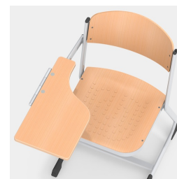
Stabiles und massives C-Form Kufengestell mit Schreibaufgabe