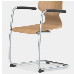
Robustes Freischwinger-Gestell mit Armlehne