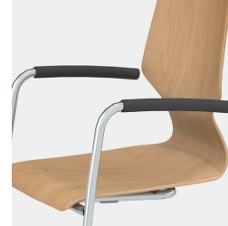
Inklusive Armlehne mit schwarzem Softgrip-Überzug