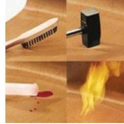
Unverwüsthliche PAGHOLZ®-Schale, kratz-, bruch-, stoßfest & schwer entflammbar