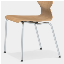
Robustes 4-Bein Gestell