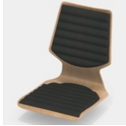
Optional mit Sitz- und Rücken-Wellenpolster