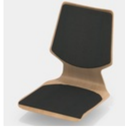
Optional mit Sitz- und Rücken-Flachpolster