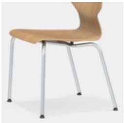
Robustes 4-Bein Gestell