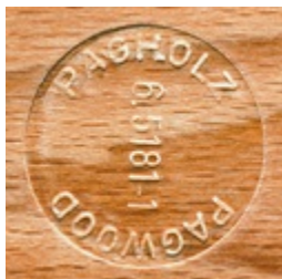
PAGHOLZ® aus nachhaltiger Forstwirtschaft