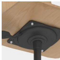
Höhenverstellung durch Sicherheitsgasfeder