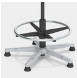
Robustes Alu-Fußkreuz mit Erhöhung und verchromtem Fußring, höhenverstellbar