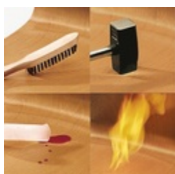
Unverwüsthliche PAGHOLZ®-Schale, kratz-, bruch-, stoßfest & schwer entflammbar