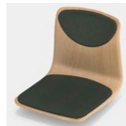
Optional mit Sitz- und Rückenpolster (nur Gr. 6E, 7)