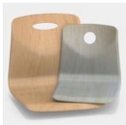
Optional mit Griffloch, rund oder oval (nicht mit Rückenpolster)