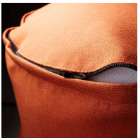
Couverture amovible avec fermeture éclair