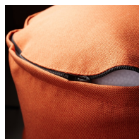
Couverture amovible avec fermeture éclair