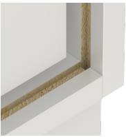
Verzugsfestigkeit durch 8 mm starke Rückwand