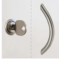
Standardmäßig mit Schloss und Griff, 1 OH mit Schloss oder Griff