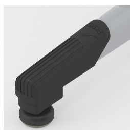
Bodenschoner mit integriertem Trittschutz und Neiveauausgleich