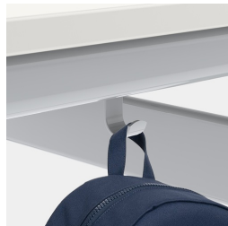
Inklusive einem Mappenhaken je Sitzplatz